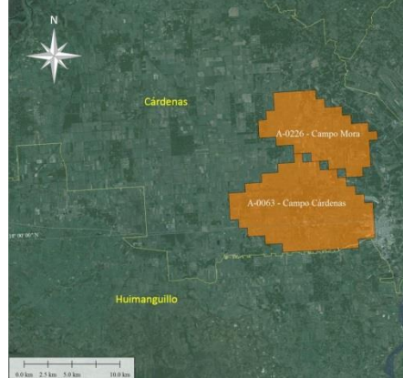
Campo Cárdenas Mora