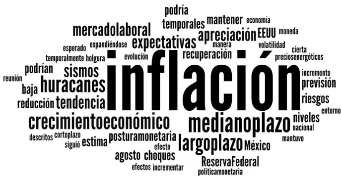
Nube lingüística del comunicado de septiembre 2017