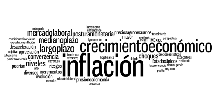
Nube lingüística del comunicado de agosto 2017