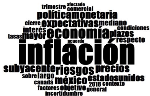
Nube lingüística del comunicado de octubre 2018