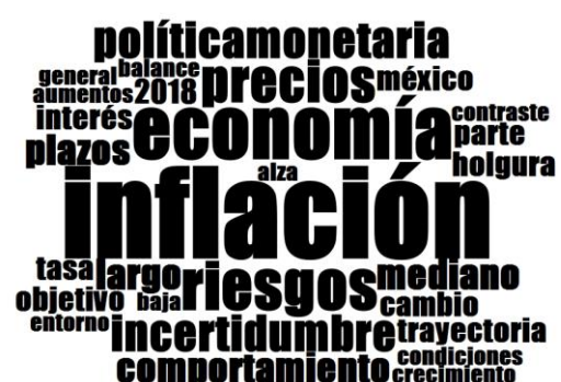
Nube lingüística del comunicado de agosto 2018