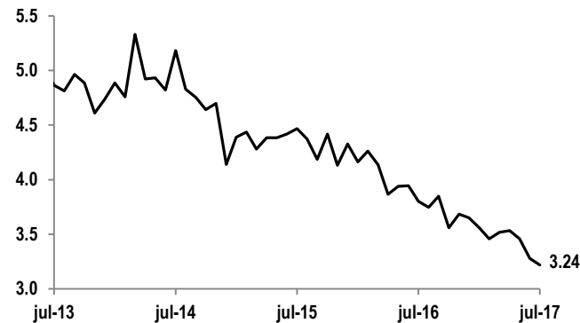
Tasa de desempleo %, ajustado por estacionalidad