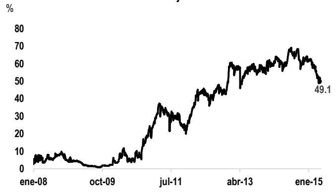
Tenencias de Cetes en manos extranjeras