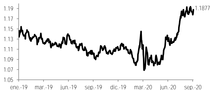
Tipo de cambio Dólares por euro

El mercado estaba atento a los comentarios de Lagarde en torno a la fuerte apreciación del euro. Esto se da en un contexto en el cual la moneda se ha fortalecido 6.2% en lo que va del año y más de 11% desde marzo a la fecha frente al dólar (ver gráfica abajo). En la conferencia de prensa, Lagarde explicó que la fortaleza de la moneda genera presiones a la baja sobre los precios y dijo que están monitoreando de cerca el desempeño del euro debido a su potencial impacto en la inflación. Sin embargo, no mostró señales de que se considere ajustar la política monetaria para hacer frente a esta situación, reafirmando que el tipo de cambio no es un objetivo de la política monetaria. Como resultado, la moneda llegó a tener una apreciación adicional de hasta 0.9% en la sesión. En nuestra opinión, esta situación ha estado influenciada por: (1) Un contexto donde el ECB se ve muy poco dispuesto a reducir las tasas de interés, que ya se encuentran en terreno negativo; (2) el reciente cambio en las metas de largo plazo y estrategia de política monetaria del Fed –con un objetivo de inflación de 2% en promedio, entre otras medidas–, que apunta a que la tasa de referencia no subirá por un tiempo muy prolongado y ha inducido mayor debilidad del dólar a nivel global; y (3) recientes sorpresas positivas en términos de actividad económica en la Eurozona (lo que apoya el ajuste de los pronósticos publicado hoy).