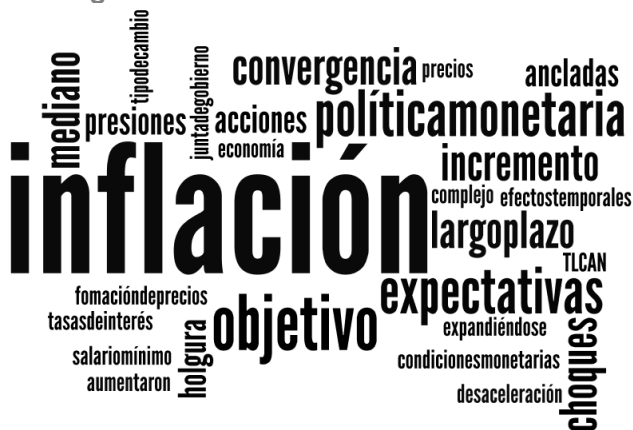
Nube lingüística del comunicado de diciembre 2017