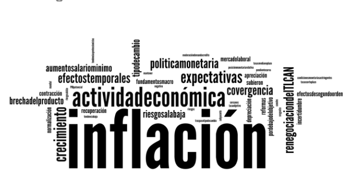
Nube lingüística del comunicado de noviembre 2017