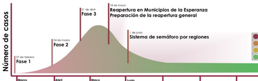
Plan de reapertura en etapas del gobierno federal

Plan de tres etapas para reabrir la economía. El día de hoy, en la conferencia de prensa matutina, el gobierno federal presentó la guía general del plan para la reapertura de la economía. El plan consiste de tres etapas principales: (1) La reapertura de 269 municipios en 15 estados de la república el 18 de mayo; (2) desarrollo de estrategias para el reinicio de actividades de los negocios del 18 al 31 de mayo y la designación de la construcción, minería y fabricación de equipo de transporte como actividades esenciales; y (3) un nuevo indicador por fases (semáforo) que señalará que estados podrán iniciar la reapertura gradual de las actividades económicas y sociales, mismo que iniciará el 1° de junio (ver gráfica, abajo).