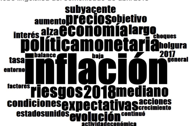
Nube lingüística del comunicado de abril 2018