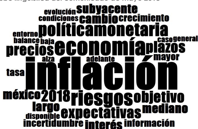
Nube lingüística del comunicado de mayo 2018