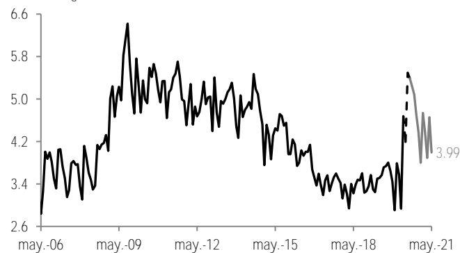
Tasa de desempleo %, cifras originales

Nota: Las líneas punteadas corresponden a las cifras de la encuesta telefónica. La línea gris corresponde a la nueva versión de la ENOE