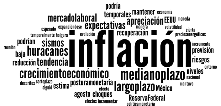
Nube lingüística del comunicado de septiembre 2017