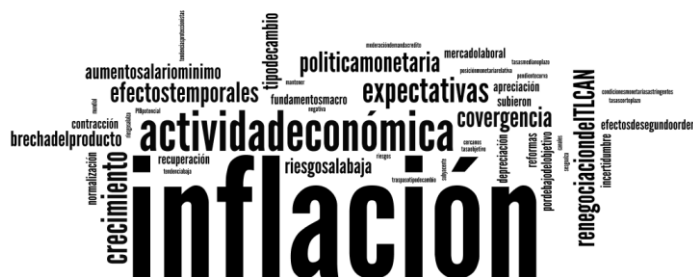
Nube lingüística del comunicado de noviembre 2017