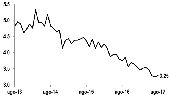
Tasa de desempleo %, ajustado por estacionalidad