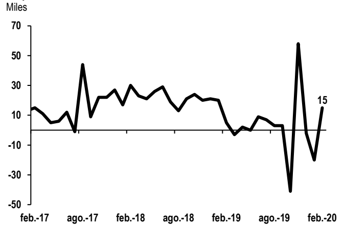
Empleos creados en el sector manufacturero