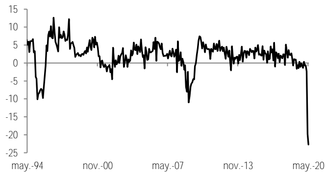
Gráfica 1: IGAE % a/a cifras originales