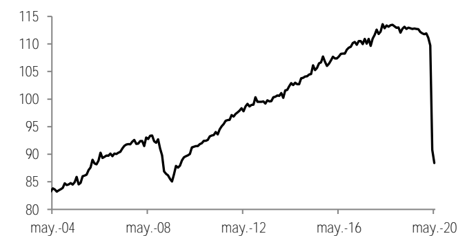
Gráfica 4: IGAE Índice ajustado por estacionalidad