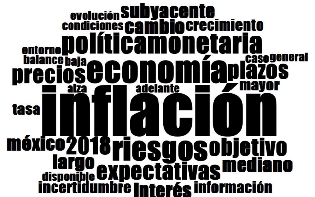
Nube lingüística del comunicado de mayo 2018