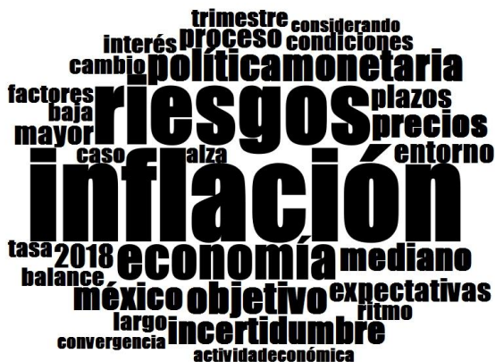
Nube lingüística del comunicado de junio 2018