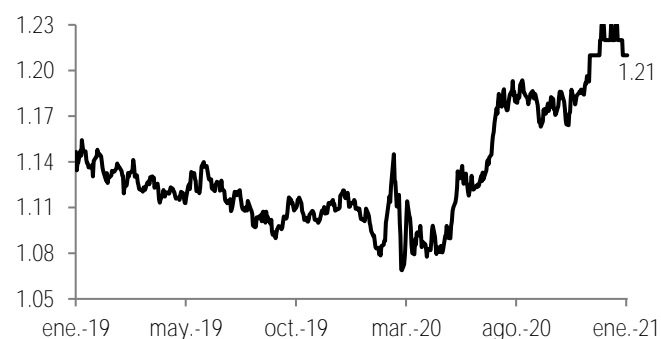
Tipo de cambio Dólares por euro

Finalmente, la apreciación del euro frente al dólar (ver gráfica abajo, izquierda) es otro factor que preocupa al banco central desde hace meses, generando mayores presiones a la baja para la inflación (gráfica abajo, derecha) que ya lleva cinco meses consecutivos en terreno negativo. En este contexto, el ECB destacó que continuará monitoreando muy de cerca este tema.