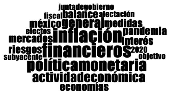
Nube lingüística del comunicado de junio 2020