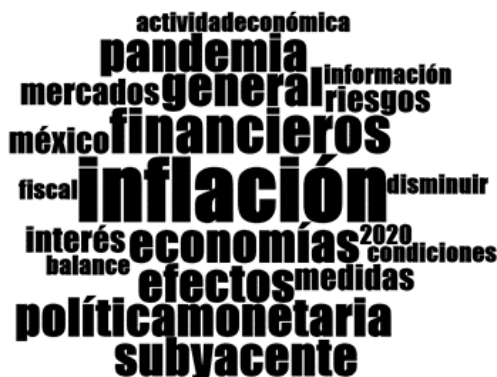
Nube lingüística del comunicado de agosto 2020

Documento destinado al público en general